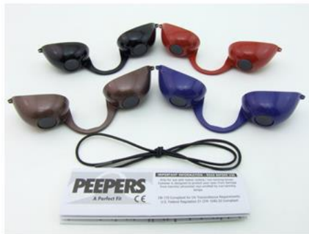
GE0001 – Peepers – Nero, bronzo, blu e rosso

Descrizione del prodotto: GE0001 Peepers & GE0009 Peepers Modern, DPI di II categoria, Occhiali protettivi per abbronzatura con lampade solari da interno