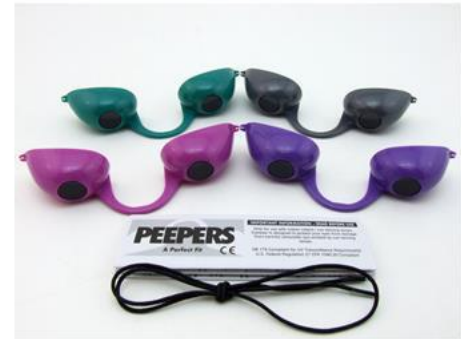
GE0009 – Peepers Modern – Grijs, Paars, Roze en Turkoois

Wij, Australian Gold, LLC, verklaren op eigen verantwoordelijkheid dat de hierboven genoemde producten in overeenstemming zijn met de volgende verordeningen: