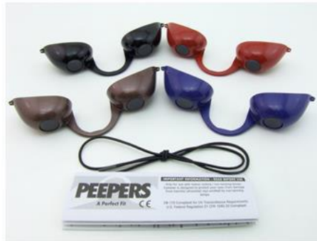
GE0001 – Peepers – Zwart, Brons, Blauw en Rood

GE0001 Peepers & GE0009 Peepers Modern, Categorie II PBM, veiligheidsbrillen voor zonnebaden met binnenbruiningslampen