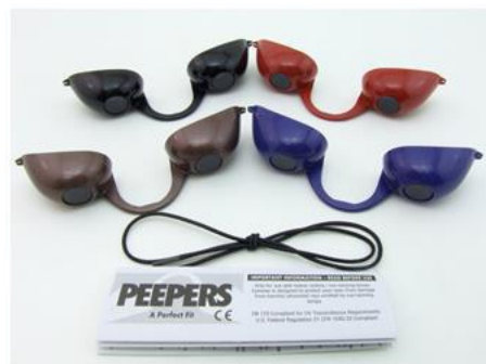
GE0001 – Peepers – Schwarz, Bronze, Blau und Rot

Produktbeschreibung: GE0001 Peepers & GE0009 Peepers Modern, PSA der Kategorie II, Schutzbrillen für die Besonnung mit Bräunungslampen