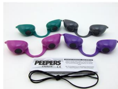
GE0009 – Peepers Modern – Grå, lilla, pink og turkis