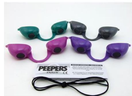
GE0009 – Peepers Modern – Grau, Lila, Rosa und Türkis